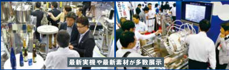
最新実機や最新素材が多数展示